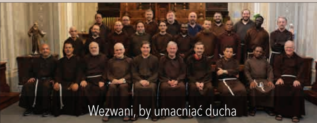
Wezwani, by umacniać ducha