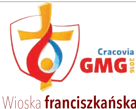
Wioska franciszkańska - 5 minuti