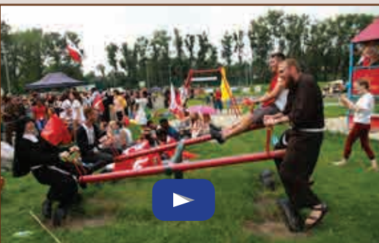
Wioska franciszkańska - italiano