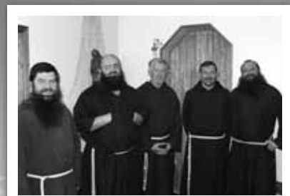
...et en Islande