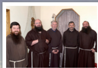
...dan di Islandia

yang berasal terutama dari Polandia. Saudara berusaha agar terbuka terhadap semua orang. Pengetahuan bahasa Polandia membantu mereka dalam karya pastoral”. “Apa yang sedang diperbuat di sana -- diteruskan oleh Minister general -- sesuai dengan prinsip siap pergi ke tempat ke mana orang tidak bersedia pergi”. Kehadiran kita di Islandia memerlukan tambahan tenaga dan uskup bersedia menyediakan rumah dan mempercayakan pelayanan di ibu kota sendiri. Islandia ternyata pulau terbuka dan mengharap saudara kapusin lain yang berani.